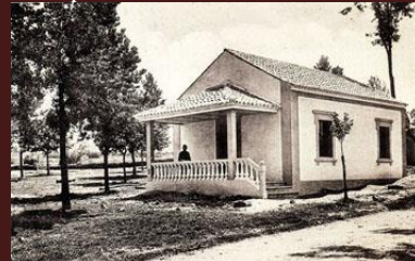
Grupo escolar “Arrabales”