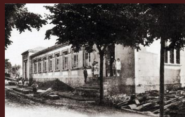
Grupo escolar Desiderio Varela